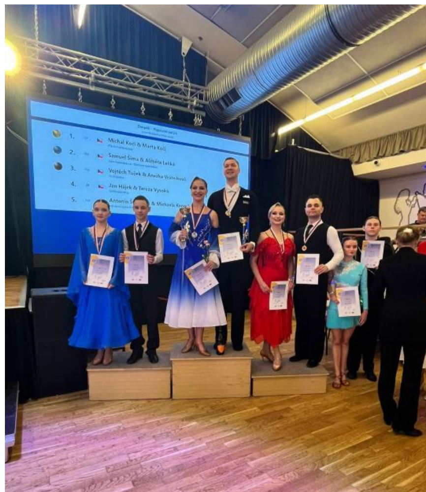
Sportovní taneční klub

Oběma tanečnickům moc gratulujeme k tomuto významnému kariérnímu posunu a děkujeme za skvělou reprezentaci. Jen tak dál!