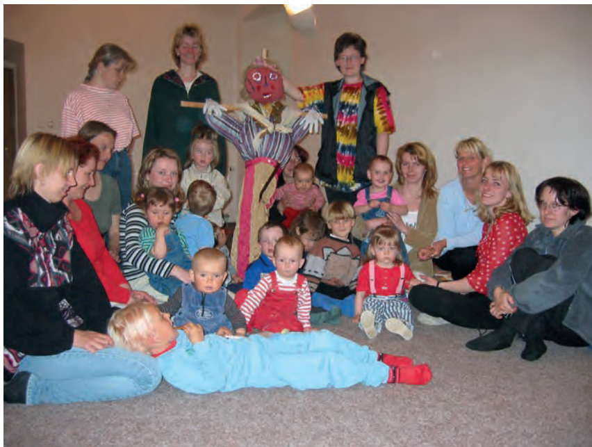
Fotografie z přípravy Čarodějnice, duben 2003

tatínků se povedlo v roce 2004 zabydlet první prostory, které byly v přízemí domu pro seniory. Pak přišly první projekty a s nimi peníze na vybavení a program, s tím i kupa závazků a tak bylo na čase zaměstnat první pracovníky. V roce 2007 se Mateřidouška přestěhovala do stávajících prostor. S rostoucí profesionalizací organizace ubylo dobrovolníků, ale o to více si vážíme všech, kteří Mateřidoušce jakkoli pomáhají. Mateřidouška je nezisková organizace, která nemá jiného zřizovatele než své členy. Není příspěvkovou organizací a tedy stát, kraj ani město jí nezasílají pravidelné finanční příspěvky. Každou korunu si na svoji činnost musí sama vydělat, získat od sponzorů nebo z vypsaných projektů. Její existence je tedy každým rokem znovu a znovu nejistá a proto si moc vážíme sponzorů, dobrovolníků a v neposlední řadě Města Raspenava, které činnost Mateřidoušky podporuje již řadu let.