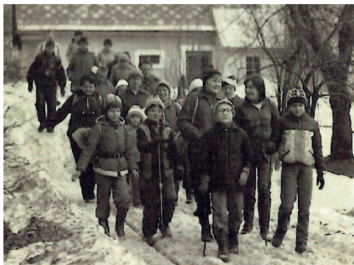
Historická fotografie z Raspenavského pochodu