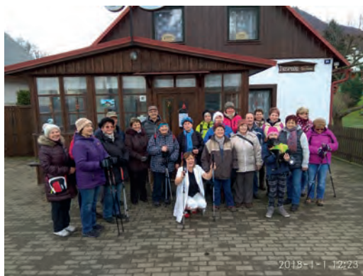
Novoroční výlet 2018