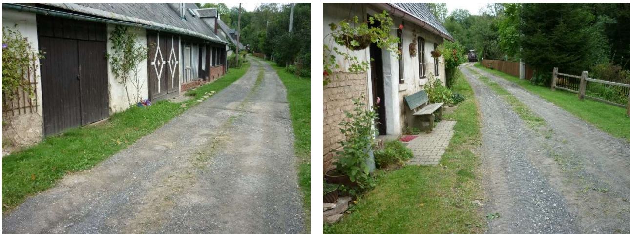
Obr. 3, 4, 5 a 6 – Pohled na MK a sousední zástavbu v těsné blízkosti hlavního dopravního prostoru