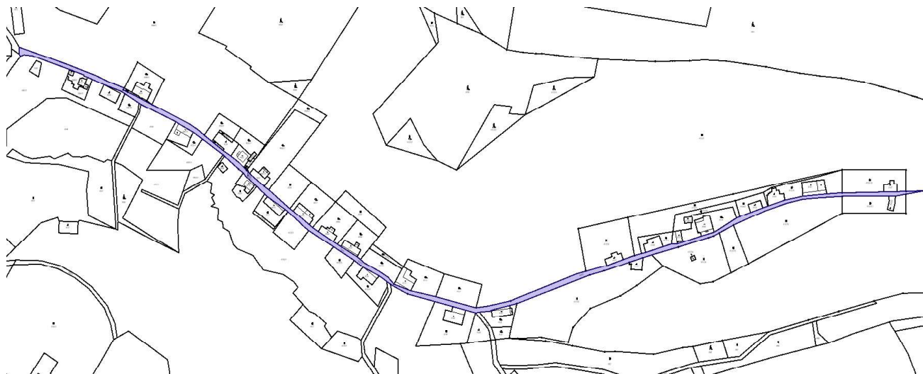
Obr. 2 – Řešená místní komunikace na p.p.č.4057/1 v k.ú. Raspenava

místní zkušenosti, jelikož se noví hosté téměř každý víkend či týden střídají. Komunikace je vzhledem ke svému šířkovému uspořádání, charakteru povrchu a těsně situované zástavbě typickým představitelem místní obslužné komunikace, která by se navrhovala dle platných ČSN 73 6110 v návrhové rychlosti maximálně 30 km/h. Této rychlosti by byly uzpůsobeny všechny návrhové parametry komunikace (rozhledové poměry, výškové a směrové parametry, výhybny, sklony, poloměry, atd.).