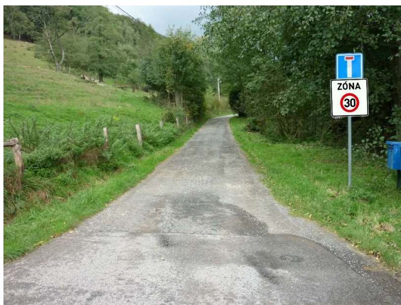
Obr. 7 – Navržená dopravní značka IZ 8a na stávající sloupek pod SDZ IP 10a, IZ 8b bude osazena z druhé strany na stejný sloupek