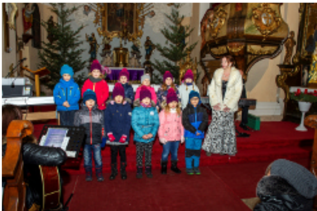
Foto Antonína Bělonožníka nám připomíná vystoupení dětí zdejší MŠ na loňském koncertu

Věřím, se na společně sejdem v neděli 29. 11. 2020 od 15:00 hodin v raspenavském kostele a společně si poslechneme krásné melodie v podání špičkových umělců.