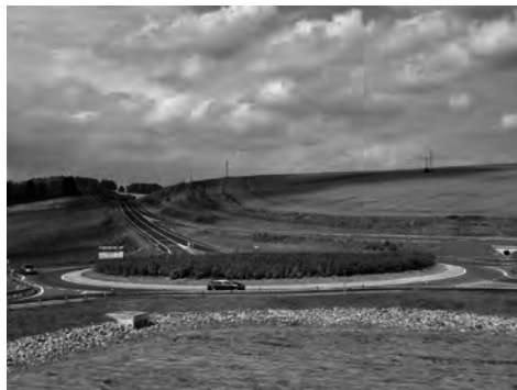
Obr. 2: R35 Bílý Kostel - Hrádek nad Nisou

V oblasti silniční dopravy byla realizována například silnice R 35 Bílý Kostel – Hrádek nad Nisou. V rámci tohoto projektu došlo vedle samotné výstavby silnice I/35 v hlavní trase rovněž i k přestavbě mimoúrovňové