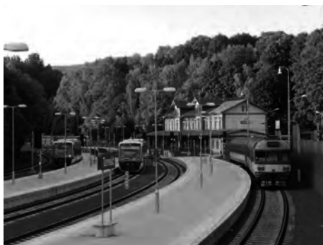
Obr. 1: Trať 036 Liberec - Tanvald

V oblasti silniční dopravy byla realizována například silnice R 35 Bílý Kostel – Hrádek nad Nisou. V rámci tohoto projektu došlo vedle samotné výstavby silnice I/35 v hlavní trase rovněž i k přestavbě mimoúrovňové