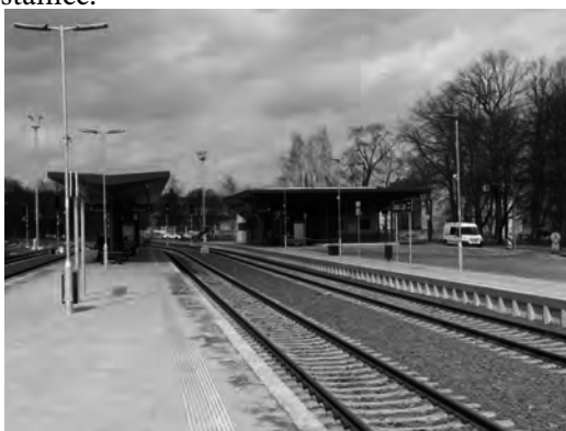
Obr. 3: Modernizace ŽST Česká Lípa

V rámci OPD2 byl v Libereckém regionu realizován například projekt Modernizace ŽST Česká Lípa. Předmětem projektu byla jak modernizace železniční stanice, tak současně i rekonstrukce navazujících jednokolejových traťových úseků zaústěných do železničního uzlu Česká Lípa. Ve stanici i přilehlých úsecích byla provedena rekonstrukce železničního svršku a spodku, umělých staveb a železničních přejezdů. Ve stanici byla vybudována dvě ostrovní a jedno boční nástupiště. Díky tomu je přístup na nástupiště nyní podchodem, který zároveň propojil části města po obou stranách stanice. Ve stanici i na všech návazných úsecích byla zřízena bezстыková kolej. Součástí stavby byla i rekonstrukce dvou železničních mostů na severním zhlaví stanice.