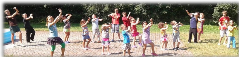
Foto z LETNÍHO TANEČNÍHO SOUSTŘEDĚNÍ v Raspenavě 2015- děti od 5-12let

Raspenava, okres Liberec, IČO 46744711 email: stkraspenava@email.cz , fcb: Jiskra Raspenava, z.s.