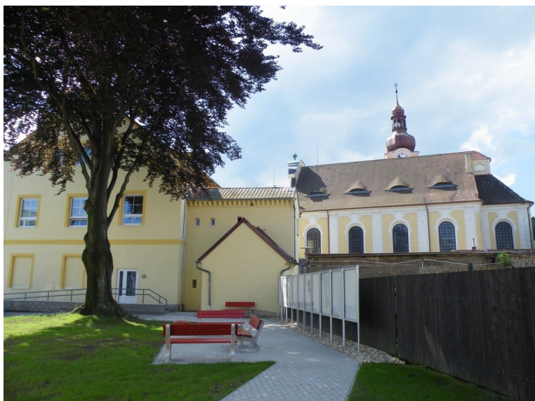
Veřejné prostranství u budovy městského úřadu