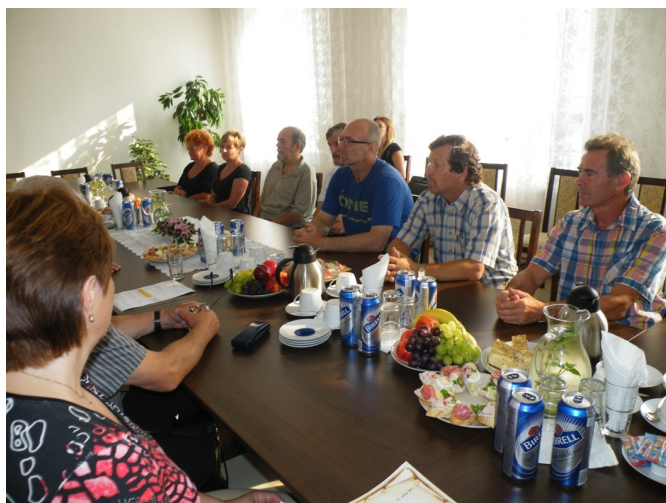
V zasedací místnosti úřadu