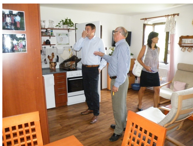
Při návštěvě Domova