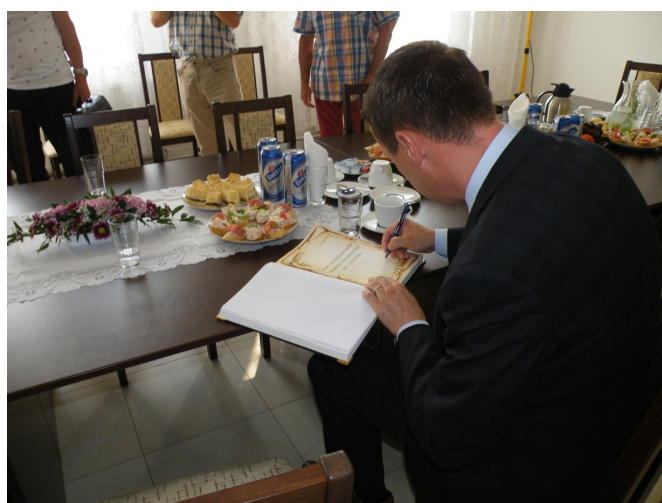
Podpis do kroniky města