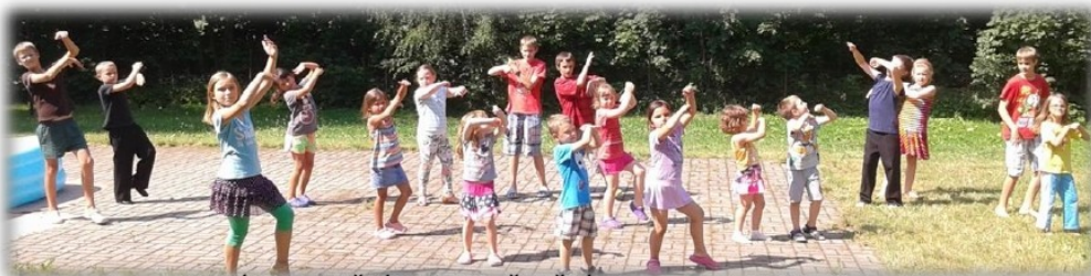
Foto z LETNÍHO TANEČNÍHO SOUSTŘEDĚNÍ v Raspenavě 2015- děti od 5-12let

Raspenava, okres Liberec, IČO 46744711 email:stkraspenava@email.cz, fcb: Jiskra Raspenava, o.s.