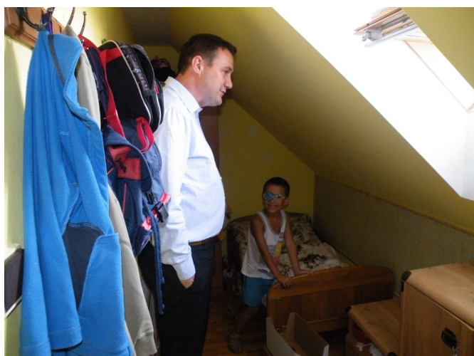
Při návštěvě Domova