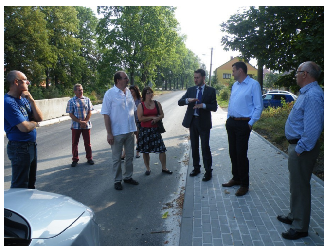
Ve Fučíkově ulici