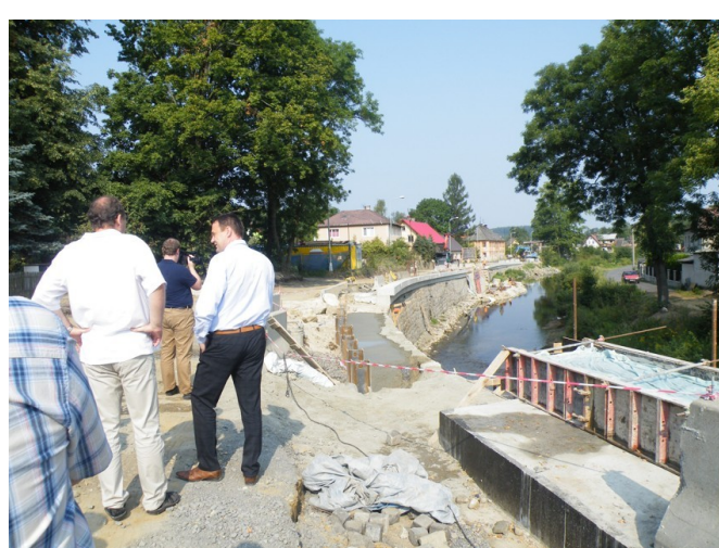
Ve Fučíkově ulici