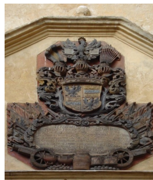
Erb Gallasů na Frýdlantském zámku