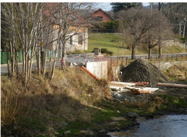
Oprava břehové zdi v ul. Luhové