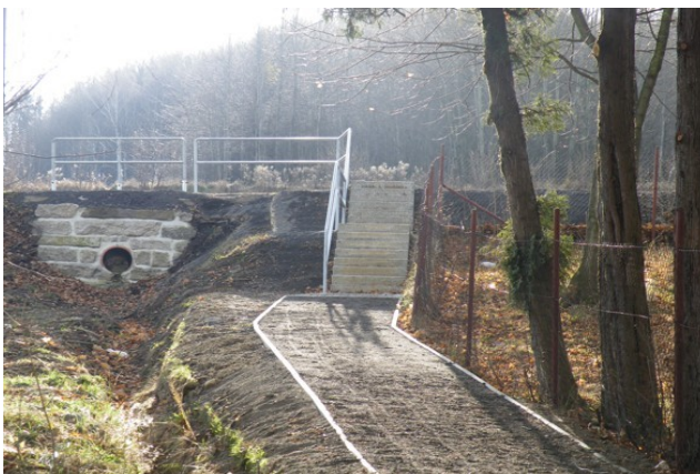
Cesta kolem fary