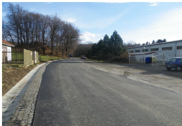
Komunikace nad fotbalovým hřištěm