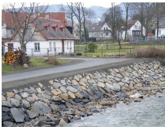
Břeh v ul. Luhová (naproti MěÚ)

Požádali jsme Ministerstvo pro místní rozvoj ČR o další finanční pomoc, a to na opravu majetku města poškozeného povodní a záplavou v letošním roce. Jedná se o opravu kanalizace ve Sportovním areálu, břehové zdi v ul. Luhová (napojení ul. Na Výsluní) a komunikace spojující ul. U Stadionu a silnici na Ludvíkov. Realizace oprav by měla proběhnout v příštím roce.