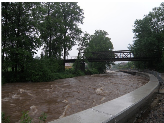
Ul. Jabloňová + Nábřeží u viaduktu