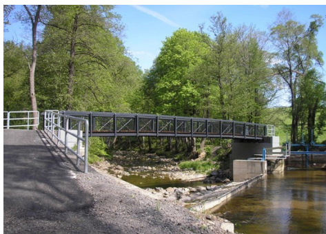
Cyklolávka V Údolí