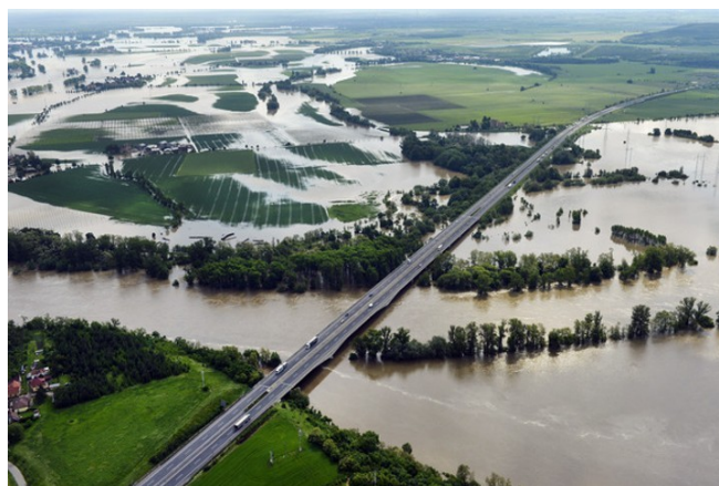
Dálnice u Veltrus