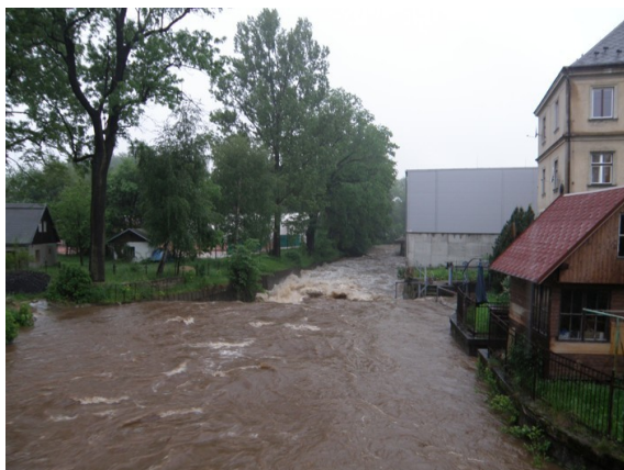
Od NOVUSu po proudu