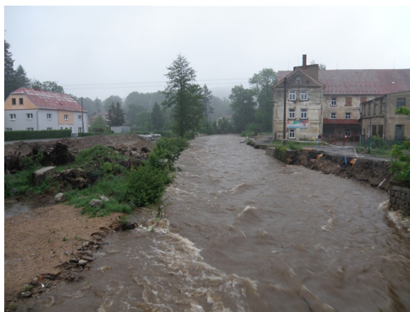
Od NOVUSu, fa. BWS