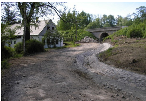
Cyklostezka V Údolí

Foto a zápis: Miroslav Těšina 20. 5. 2013