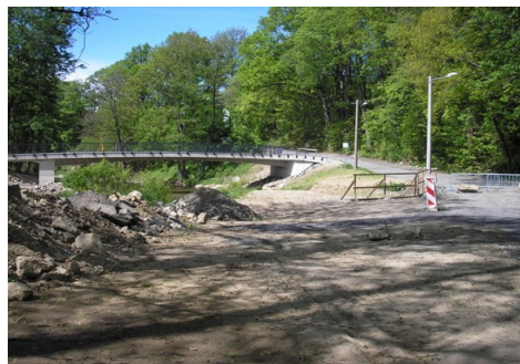
Lávka z Luhové ul. do Údolí