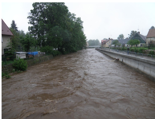
Nábřeží po proudu