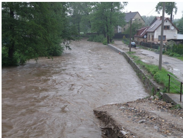
Od velkého mostu po proudu