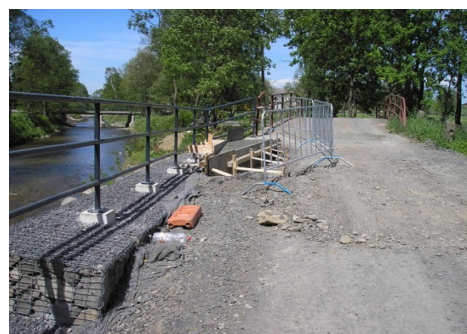
Luhová ulice u Lomnického potoka