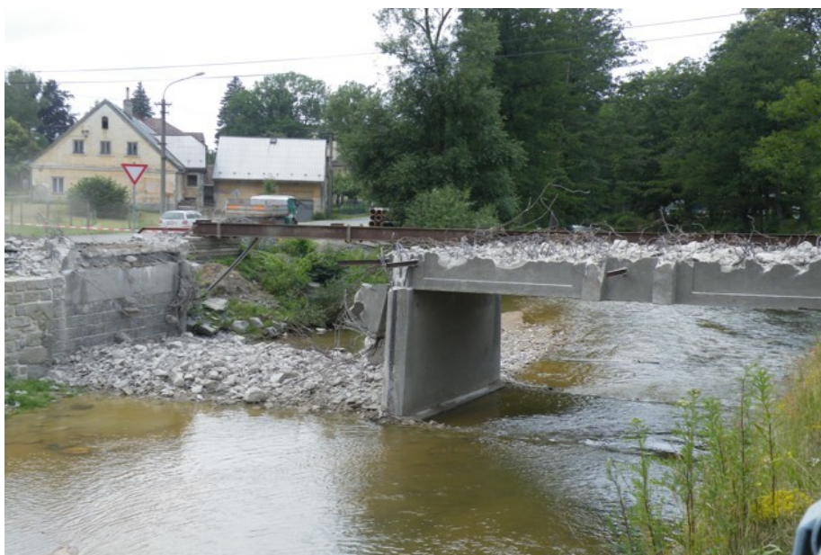
Demolice mostu u mlýna 10. 7. 2013

Snažíme se ovlivnit i výstavbu břehové zdi u městského úřadu tak, aby se na komunikaci mezi budovou pošty a lékárny obnovil provoz již letos. Investorem stavby je Správa a údržba silnic Libereckého kraje.