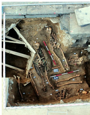
Hroby u kostelní zdi