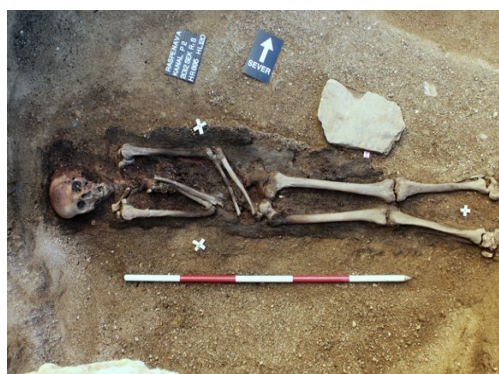
Hrob v presbyteriáři