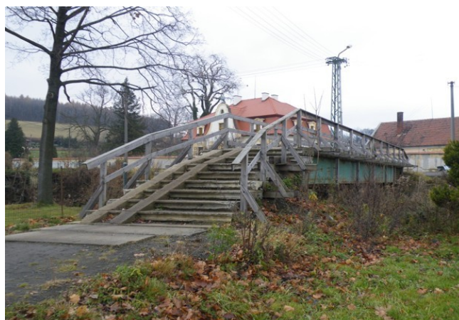
Provizorní lávka nedaleko kostela

Z výše uvedené dotace město Raspenava uhradilo výdaje za nájem provizorních lávek v celkové výši 792 tis. Kč, výdaje spojené s demolicí bývalé mateřské školy ve výši 2 092 tis. Kč, výdaje za materiál na údržbu komunikací ve výši 360 tis. Kč a opravu komunikací ve výši 272 tis. Kč, výdaje za uložení povodňových odpadů na skládku ve výši 345 tis. Kč, výdaj na rekonstrukci ČOV u domu čp. 423 a čp. 315 ve výši 218 tis. Kč, výdaje spojené s vysoušením přízemí čp. 423 ve výši 43 tis. Kč a výdaj na opravy v byt. domě čp. 426 ve výši 38 tis. Kč a opravu v ZŠ čp. 430 ve výši 38 tis. Kč.