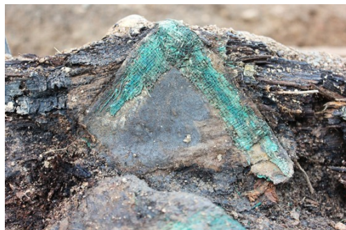
Dochovaná rakev a část textilie