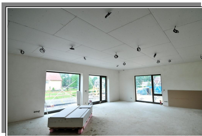
Herna v nové MŠ