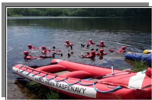
Výcvik hasičů na Šolcově rybníku